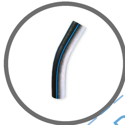
30°, 45°, 60°